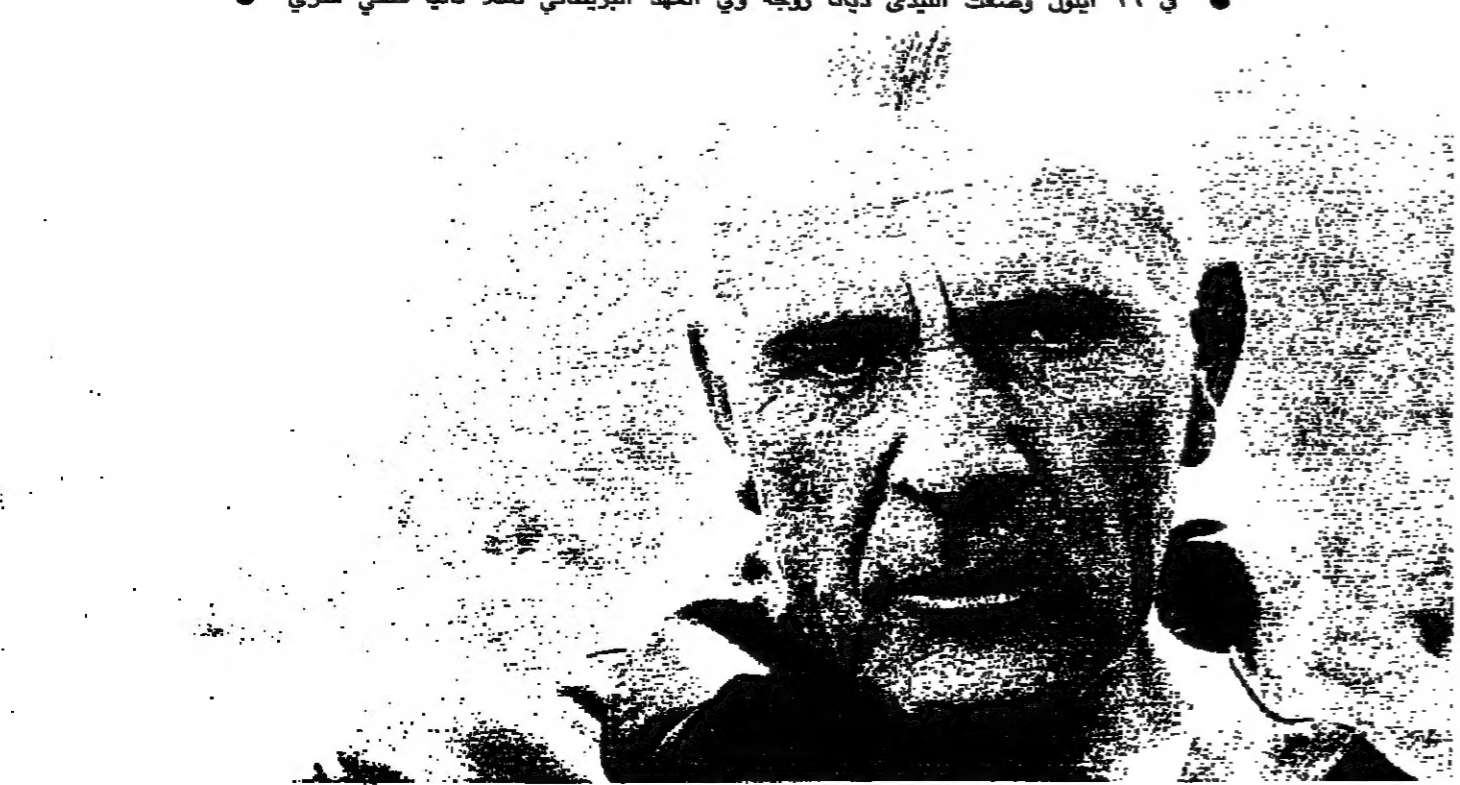
● الممثل ريتشارد بورثون توفي في ٥ آب ١٩٨٤ . وهذه الصورة من اخر فيلم له